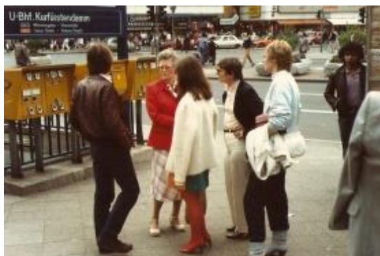
DM 1983 in Berlin